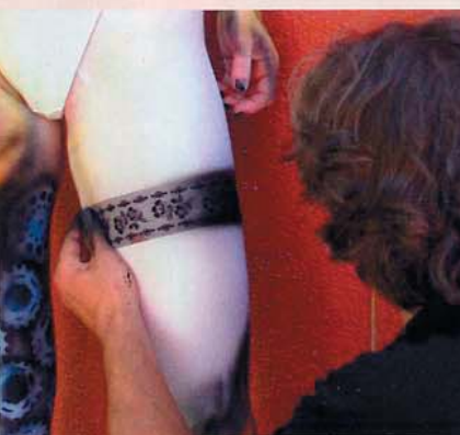
Aus der Trickkiste: Strumpfbänder und Ritzel sind kleine Helfer