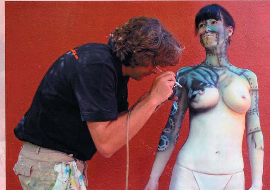
◀ „Ihr spielt auf den Spaßfaktor mit nackten Models an? Die Wirklichkeit sieht anders aus.“