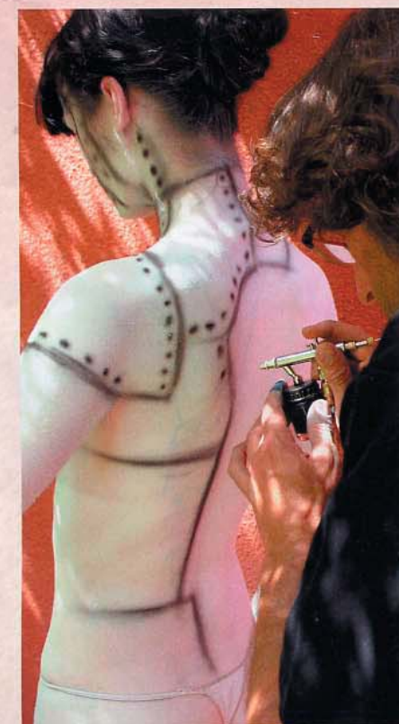
Der Körper wird mit Panzer-Segmenten neu gegliedert