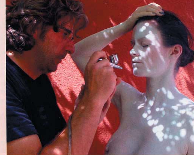
Model Christine bekommt mit weißer Grundierung erstmal eine gesunde Blässe

▼ Roland Oberndorfer trägt den Künstlernamen „Airol“. Er hat sein Handwerk auf einer Kunst- und Zeichenschule gelernt